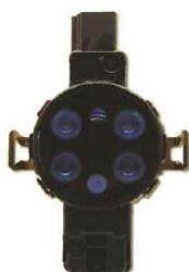
Type 18 pluie/luminosité) sans dispositif électronique