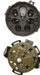
Type H1 (pluie/luminosité) avec dispositif électronique