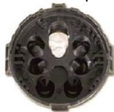
Type H1 (pluie/luminosité) sans dispositif électronique