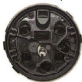
Type H2 (pluie/luminosité) sans dispositif électronique