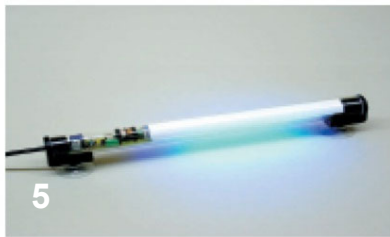
5 Das Harz härtet unter UV Licht aus und garantiert damit eine dauerhafte Reparatur