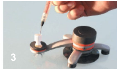
3 Injektorzylinder einschrauben und mit Füllharz befüllen