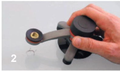
2 Werkzeughalter über der Einschlagstelle befestigen