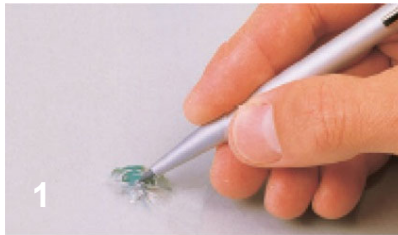
1 Einschlagstelle von Schmutz und losen Glassplittern reinigen